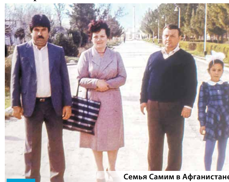
Семья Самим в Афганистане

О традициях двух стран, которые переплелись в большой интернациональной семье